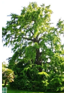
Ginkgo in de Hortus