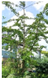
Ginkgo in mijn voortuin