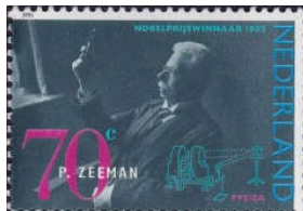
Pieter Zeeman. Uit de serie 'Nobelprijswinnaars. 1991'

Ook Hendrik Lorenz en Pieter Zeeman kregen (in 1902) de Nobelprijs voor natuurkunde. Lorenz studeerde in Leiden en was daar hoogleraar. Ook Zeeman studeerde in Leiden en gaf daar een poos les.